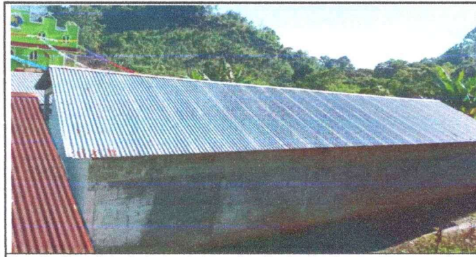
Foto 5: Otra vista de techo de las aulas No. 1 y No. 2, que con urgencia necesitan ser cambiadas para seguridad de los niños del establecimiento.