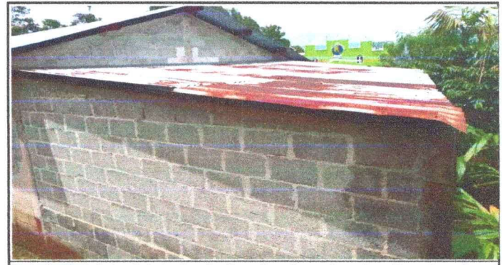
Foto 6: Vista lateral de techo de direccion de centro educativo, el cual necesita cambio de entechado.

Observación: Si es necesario se pueden agregar hojas adicionales y actualizar el número de hojas.