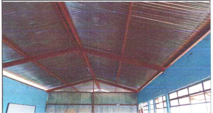
Foto 2: Estructura de las Aulas 1 y 2 que necesitan ser remozadas.