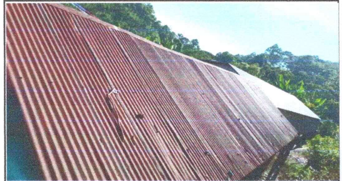
Foto 4: Techo de modulo 2 con necesidad de cambio ya que se encuentra en mal estado.