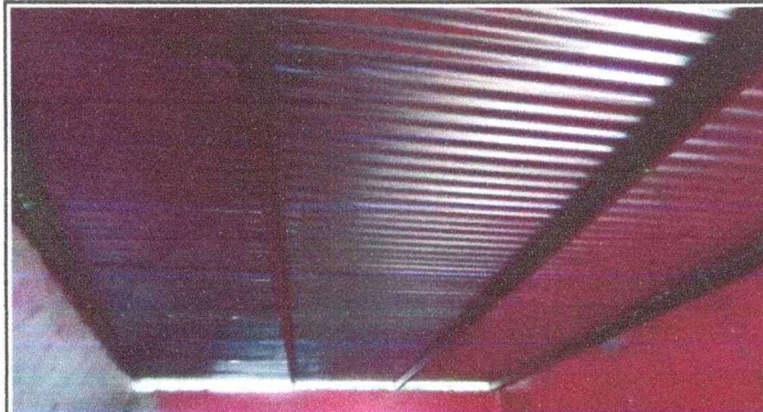
Foto 3: Estructura del techo de la direccion que necesita ser reforzada, ya que las costaneras actuales se encuentran muy separadas y en mal estado.