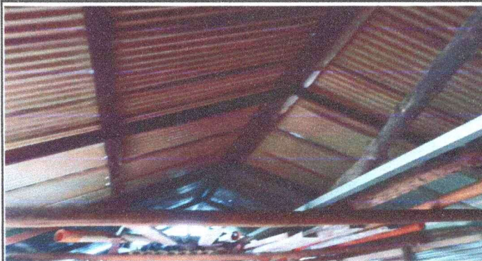
Foto1: Estructura de techo de módulo 2 deteriorada debido al tiempo que ha pasado desde su colocación.